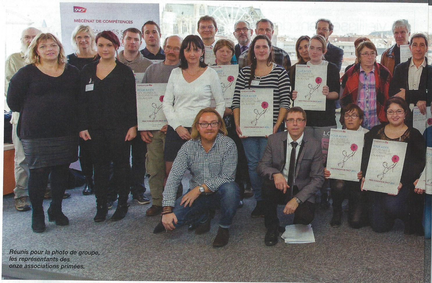
Réunis pour la photo de groupe, les représentants des onze associations primées.