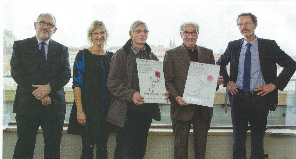
L'association Collectif d'accueil des solliciteurs d'asile en Moselle.

- La Plume de l'Argilète (Bruno Bentini). Dys'trict : livre-jeu : élaborer un livre-jeu